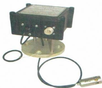
Датчик паров бензина в атмосфере азота с фланцем для установки на резервуаре (пластмассовый корпус)