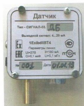
Датчик углеводородов в атмосферном воздухе (силуминовый корпус)