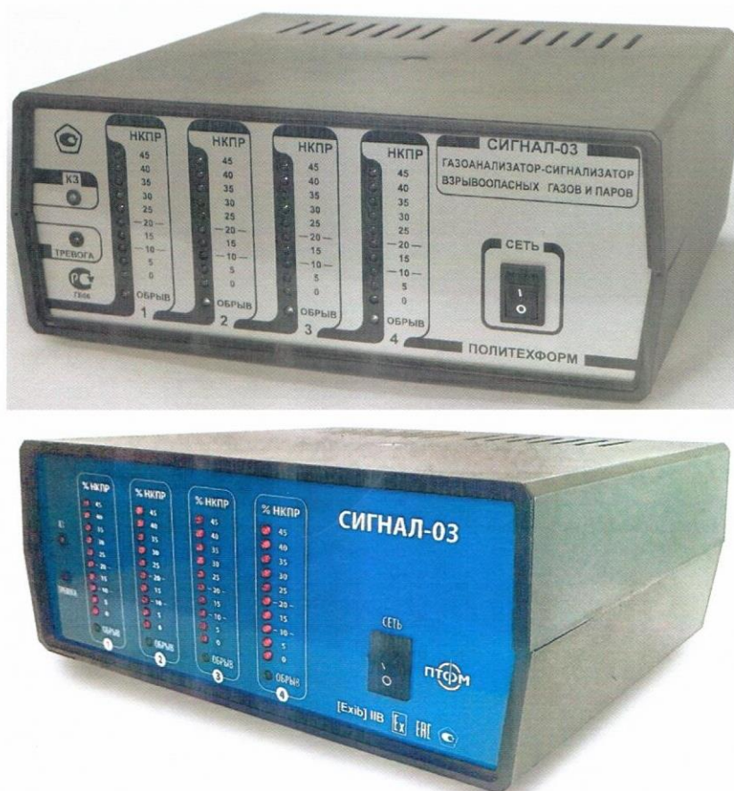
Рисунок 1 - Общий вид блока информационного газоанализатора-сигнализатора "Сигнал-03"

Блок информационный газоанализатора-сигнализатора "Сигнал-03" выполняется в пластмассовом корпусе. Общий вид блока информационного представлен на рисунке 1.