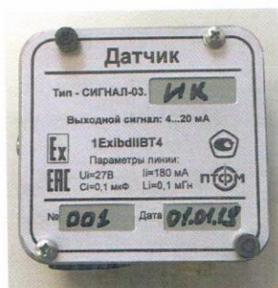
Датчик углеводородов с ИК сенсором (силуминовый корпус)

Датчики газоанализатора-сигнализатора "Сигнал-03" выпускаются в пластмассовых или силуминовых корпусах в нескольких конструктивных исполнениях, часть которых представлена на рисунке 2.