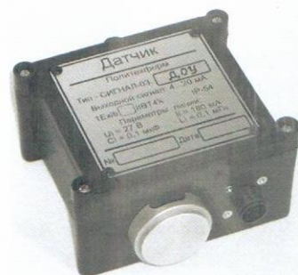
Датчик токсичных газов или кислорода (пластмассовый корпус)